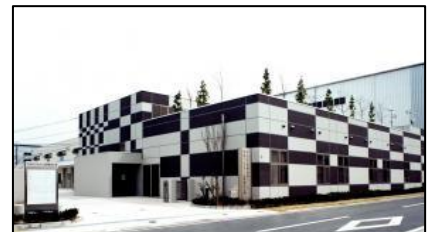
宇治市産業振興センター